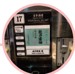
メダルを入れるとお酒が出ます!