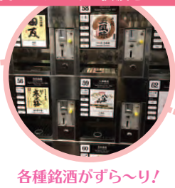
各種銘酒がずら〜り!