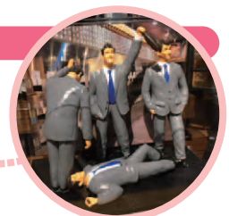
酔っ払いサラリーマン! ※くれぐれも飲み過ぎによる電車の乗り過ごしにはご注意ください。