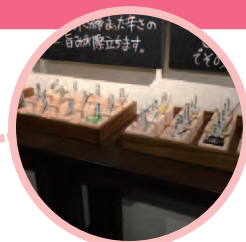
日本酒にはお塩です! さまざまな塩!