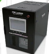
▲ 直流安定化電源 Rack System

昨年は世界の秩序や国家間の関係性が変化して行く中、私たちの生活や経済活動にも大きな影響を及ぼす一年となりました。また、地球の温暖化が目に見える形で自然現象にインパクトを与え、エネルギー・トランスフォーメーションの推進が一段と求められる年でもありました。