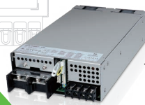
▲ 小型 大容量 ユニット型 AC-DC電源 HWS-G シリーズ

昨年とは色々とお話になりました。 まことにありがとうございます。 皆様の御多幸をお祈り申し上げます。 令和7年元旦 TDKラムダ株式会社